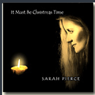
IT MUST BE CHRISTMAS TIME