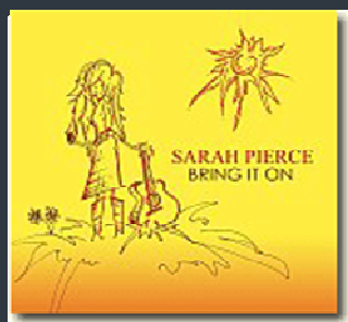
BRING IN ON

Poi, durante un viaggio in Texas, si innamora di Austin e vi si trasferisce. Da quando si è trasferita nella capitale del Lone Star State ha macinato in tour centinaia di migliaia di chilometri sia negli Stati Uniti che in Europa, ricevendo ovunque entusiastici consensi. La sua volontà di autopromuovere la propria musica ha incluso un faticoso tour coast to coast nelle 250 stazioni radio del circuito NPR suonando dal vivo e rilasciando interviste. Inoltre è andata in onda anche su MTV. Ora dopo sette cd acclamati dalla critica fino ad oggi, ha realizzato la sua ottava fatica, Bring It On , per l'etichetta Little Bear Records, in agosto 2011. Seguendo il filone del precedente Cowboy's Daughter , Sarah riscopre la sua anima musicale nelle radici della musica country, colonna sonora della sua infanzia e adolescenza, regalandoci un cd che racchiude canzoni ricche di felicità, saggezza e calore, con l'utilizzo di molti strumenti della tradizione folk e bluegrass, quali il dobro, il violino, il mandolino uniti ai suoni più pop-rock di chitarre elettriche e hammond. La voce della Pierce suona come un incrocio tra Natalie Merchant, Shawn Colvin, e Stevie Nicks e anche se Bring It On ha una forte propensione country, ha tocchi di blues e folk e tendenze pop-rock, infatti come ama dire Sarah: "sono veramente rispettosa e amo tutti gli stili musicali".