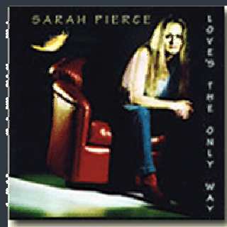
LOVE'S THE ONLY WAY