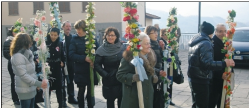
Peia - L'Offerta della Cera

bergamo avvenimenti scienze e cultura in città e provincia www.bergamoincivilliblog.it