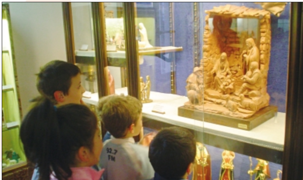
Gandino - Museo dei Presepi