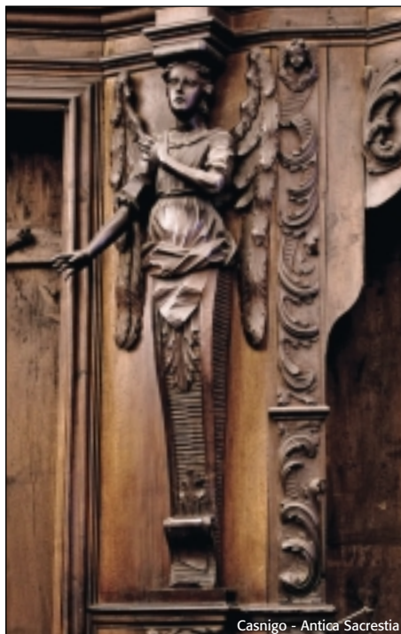
Casnigo - Antica Sacrestia