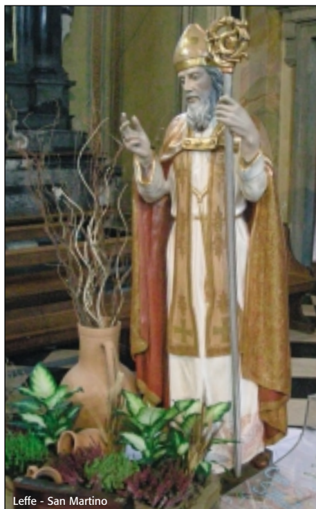
Leffe - San Martino