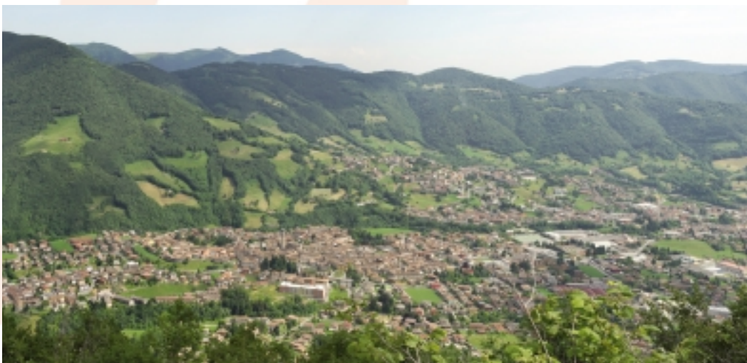
Panorama della Val Gandino