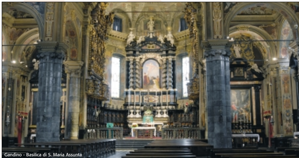
Gandino - Basilica di S. Maria Assunta

ore 21.00 Basilica S.Maria Assunta concerto e visita guidata alla Basilica e all'organo Urbani Bossi del 1858